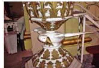
Касцёл Маці Божай Нястомнай Дапамогі. Фрагмент інтэр'еру Костел Божьей Матери Неустанной Помощи. Фрагмент интерьера