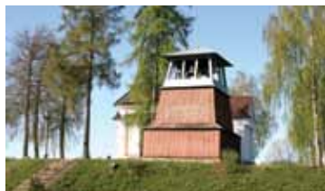
Плябаня / Плебания