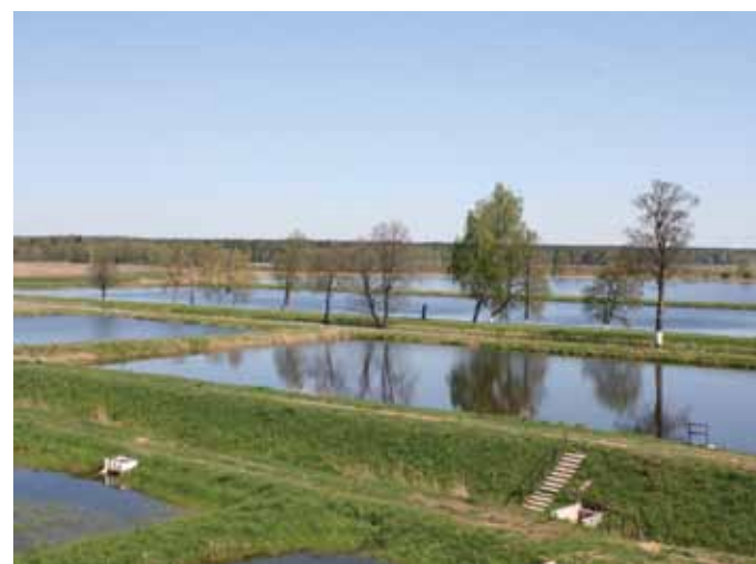
Шэметаўскія сажалкі (выкарыстоўваюцца) Шеметовские пруды (используются)