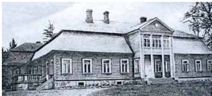
Рэшткі і пачатковы выгляд палаца Хамінскіх Сохранившиеся фрагменты и первоначальный вид усадебного дома Хоминских