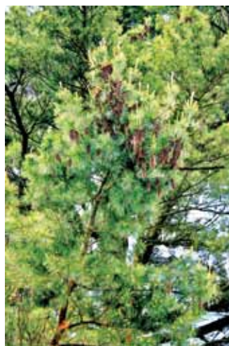
Сядзібны парк Усадебный парк

Рэшткі лядоўні і гаспадарчых пабудоў / Фрагменты ледовни и хозяйстроек