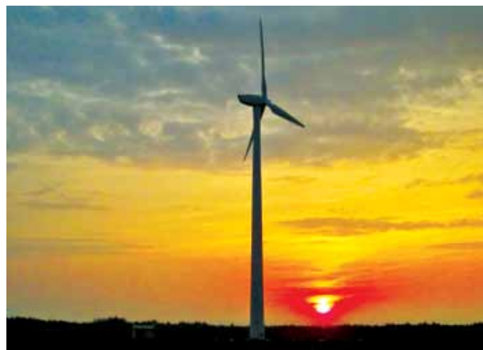
Ветразнергетычныя ўстаноўкі (ветракі) Ветроэнергетические установки (ветряки)

Последние два десятилетия Занароч и окрестности находятся в сфере деятельности международной благотворительной организации «ЭкоДом», которая реализует проекты экологически чистого строительства и использование