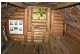
Музейны комплекс «Партызанскія базы», в. Чарэмшыцы Музейный комплекс «Партизанские базы», д. Черемшицы

В конце XVIII в. имение Занароч было владением Станкевичей, потом Добровских. С тех времен остались хозяйственные постройки из бутового камня в соседней деревушке Мокрице (бывший фольварк) – сейчас там располагается действующая конеферма. В обратной стороне от Занарочи, в урочище Скок, находится старинная система рыбохозяйственных прудов (восстанавливается).