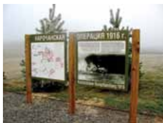
Мемарыял Першай сусветнай вайны / Меморіал Первой мировой войны

Двойчы ў вайны – Першую сусветную (у верасні 1915 г.) і Вялікую Айчынную (верасень 1943 г.) – вёска была акупавана і ўшчэнт разбурана і спалена. Як успамін аб тых гістарычных падзеях у Занарачы і наваколлі засталіся рэшткі сістэмы палявых фартыфікацыйных збудаванняў 1915–1916 гг. і сучасны мемарыял трагічным старонкам Першай сусветнай вайны.