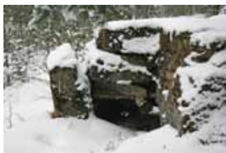
ДАКі Першай сусветнай вайны (ур. Скок) / Доты Первой мировой войны (ур. Скок)