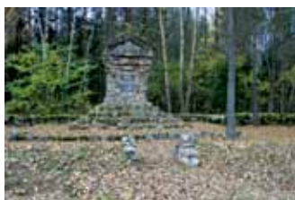
Нямецкі помнік і пахаванні Першай сусветнай вайны (в. Пронькі) Немецкий памятник и захоронения Первой мировой войны (д. Проньки)