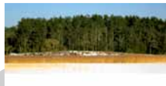
Помнік прыроды «Студзянец» Памятник природы «Студенец»

Апошнія два дзесяцігоддзі Занарач і наваколле знаходзяцца ў сферы дзейнасці міжнароднай дабрачыннай арганізацыі «ЭкаДом», якая рэалізуе праекты экалагічна чыстага будаўніцтва і выкарыстанне альтэрнатыўнай энергетыкі. Так, над вёскай узвышаюцца тры магутныя ветразэнергетычныя ўстаноўкі, падключаныя да цэнтралізаванай электрасеткі; збудавана 25 дамоў з трысняговай сыравіны і ўтвораны пасёлак Дружны; адкрыта новая амбулаторыя – адзін з першых у Беларусі энергаэфектыўных будынкаў з выкарыстаннем сонечных батарэй; адраджаны с выкарыстаннем прыродных будаўнічых матэрыялаў вясковы Дом культуры.