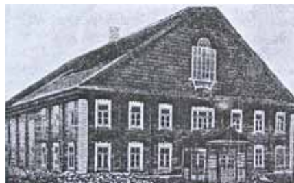
Будынак сiнагогі (не існуе) / Синагога (не существует)

яна была штучна ўзвышана для гэтай падзеі. Зараз гара з'яўляецца гісторыка-культурным помнікам, пя яе падножжа ўсталяваны абеліск воінам і партызанам Вялікай Айчыннай вайны.