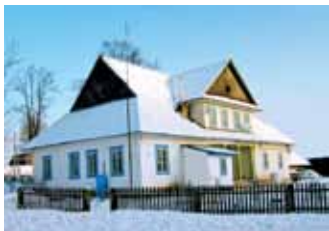
Будынак былой гміны Здание бывшей гмины