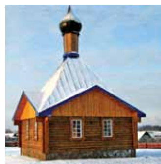
Праваслаўная царква Православная церковь