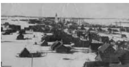
Касцёл Святога Мікалая і зvon Костел Святого Николая и колокол