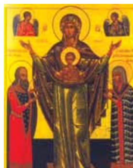
Абраз з выявай князя Даўмонта Икона с ликом князя Довмонта