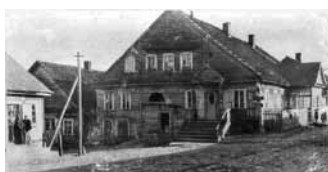
Будынак былой асторыі / Здание бывшей астории