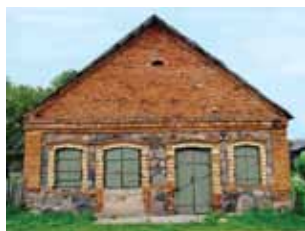
Будынак яўрэйскай лаўкі Здание еврейской лавки