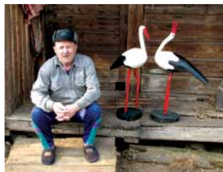
Разьбар з в. Канстанцінава Резчик из д. Константиново

Слабада сфарміравалася як тыповое мястэчка пры Полацкім тракце. У 1793 г. тут была створана парафія, якую па імя фундатара тутэйшага касцёла Канстанціна Хамінскага пасля яго смерці назвалі Канстанцінаўскай. Слабаду перайменавалі ў мястэчка Канстанцінава. У 1896 г. было завершана будаўніцтва замест драўлянага – новага – каменнага касцёла Божай Маці. Храм