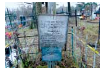
Пахаванне французкіх валанцёраў Могила французских волонтеров