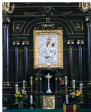
Абраз Маці Божай Снежнай / Икона Божьей Матери Снежной

На Канстанцінаўскіх могілках захаваўся маўзалеі пані Ліліі Хамінскай і шасці яе маленькіх памерлых дзяцей; на паўночна-заходняй частцы пагоста змяшчаюцца магiлы нямецкіх салдат часоў Першай сусветнай вайны.