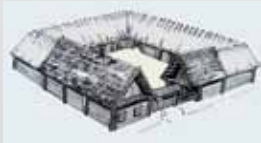
Аўтэнтычная забудова в. Варашылкі Аўтэнтычная застрыжка д. Ворошилкі