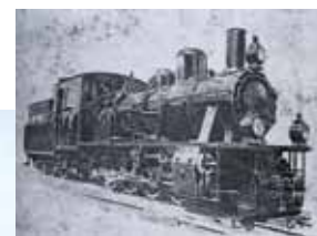
Паравоз «кукушка» Паровоз «кукушка»

ний, ямщицкие службы и таможи, где собирали налоги с товаров, работали 4 почтальона. Здесь концентрировались военная, торговая и дипломатическая деятельность, выделялись экипажи для перевозки дипломатов из Москвы в Варшаву и обратно, обеспечивались им еда и ночлег. Проезжавший путешественник мог подковать коня, заменить колесо, отремонтировать или приобрести упряжь. В отдельной конторе происходил обмен корреспонденции. Магнаты останавливались в почтовых домах, остальным – убежищем служил трактир. С появлением узкоколейки почту начали развивать поездам.